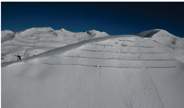
Red y Estación de Sensores en invierno