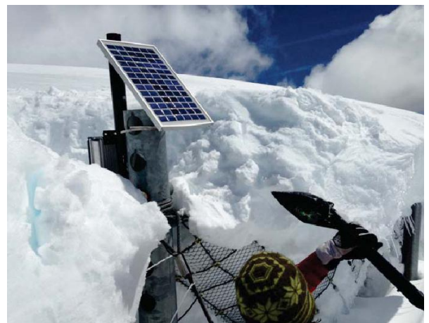
Montaje del Sensor de carga de 10 Toneladas